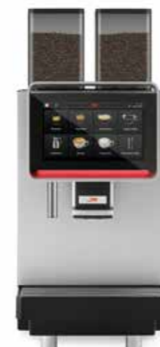
ALL IN 300

With a daily performance of about 300 brewing doses, it matches the typical requirements of medium-large hotels, canteens, self-service counters, and service stations. The touch screen display can be customized and allows choosing from a 32 beverage menu. The hot water wand with separate boiler and the availability of a version with powder ingredients dosers makes it very appreciated in bars with consumption of both coffee based and other beverages.