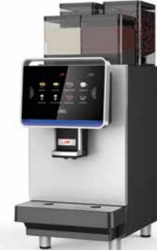
ALL IN 300 POWDER