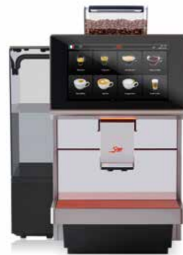
ALL IN 100 BIG TANK