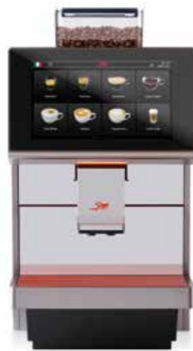
ALL IN 100

With a daily performance of about 100 brewing doses, it matches the typical requirements of offices, b&bs, small hotels, and demanding domestic environments. The touch screen display can be customized and allows choosing from a 32 beverage menu. The free-standing version with big tank is ideal for any location having only electricity available and no water line connection.